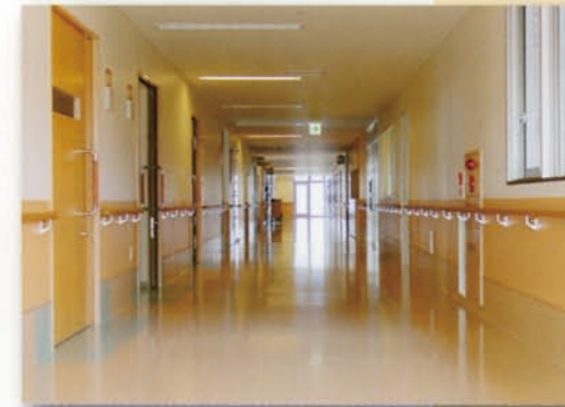
明るく、清潔な病棟